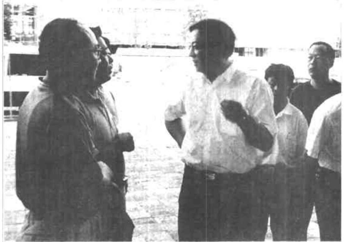
市委书记石军到经济园区检查指导工作

此外，按照区委的统一要求，园区还制定了非公有制经济组织党建工作规划纲要，制定了中共东营区经济园区党总支委员会党建工作程序流程图，制作了党总支和六个支部的党建专栏，规范了园区党的组织建设。