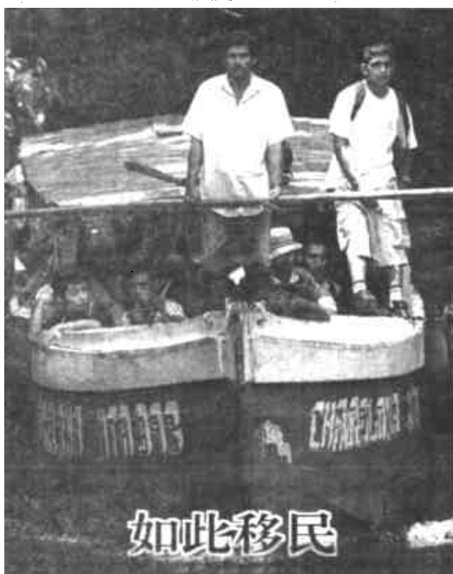
8月8日，一群尼加拉瓜人挤在小船上，打算从一条河上偷渡到哥斯达黎加。每年都有数以千计的尼加拉瓜人为了寻找工作如此“移民”去哥斯达黎加。

田增民说，远程手术充分发挥了医学专家的辐射作用。他说：“除普通医学外，这在军事临床医学、战场救治等方面也有很大的实用价值。”