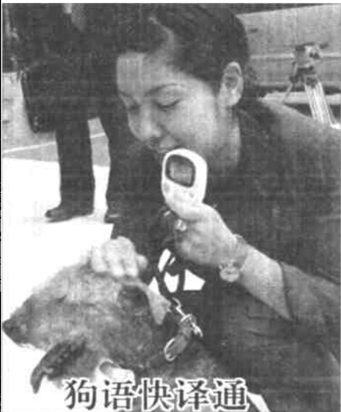
8月7日，日本一家玩具制造公司推出一款可以更好地了解宠物的电子装置。它通过挂在狗脖子上的小话筒接收狗发出的各种声音，然后在主人手中的显示器上将其“翻译”成狗目前的情绪状态。有了这种装置，不懂狗的语言，也可以很好地“明白”狗的意图了。