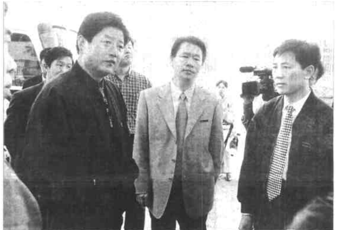
市长刘国信到园区考察调研